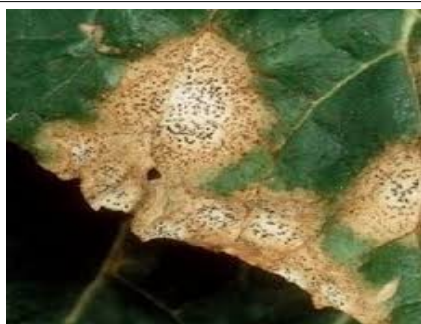
MAL DEL SECCO

ECOFLY di Ecofype + SILPO (silicato di potassio) + CONSOLIDA MAGGIORE di Ecofype (polvere)