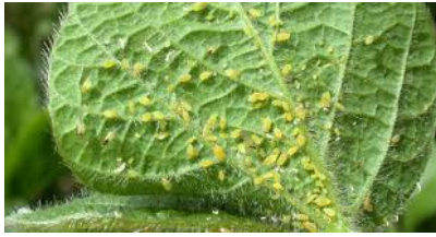
CONTRO UOVA, LARVE E